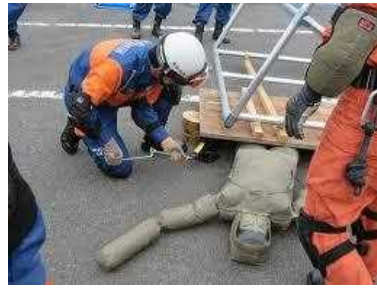
レスキュージャッキ操作