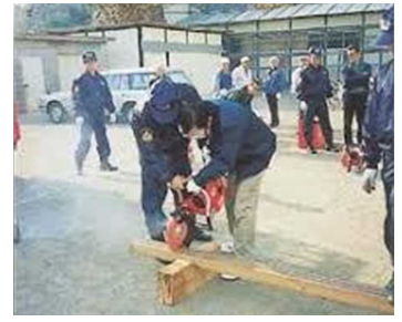
エンジンカッター操作