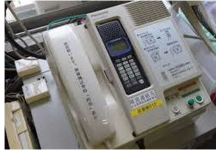
デジタル移動無線機取扱訓練