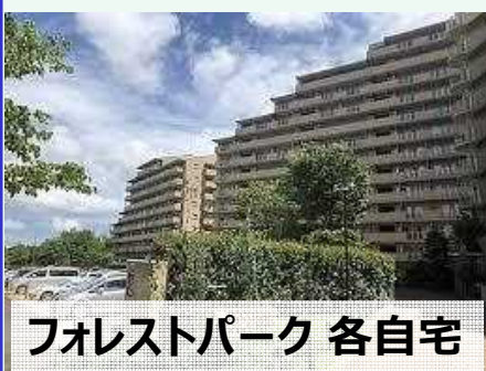
フォレストパーク 各自宅

自宅建物に火災や倒壊の危険がないときは、あえて避難する必要はありません。 ※必要に応じて判断して下さい