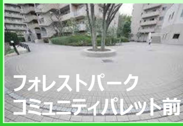
フォレストパーク コミュニティパレット前