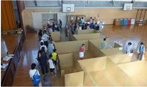
体育館の区割り避難者の割り振り